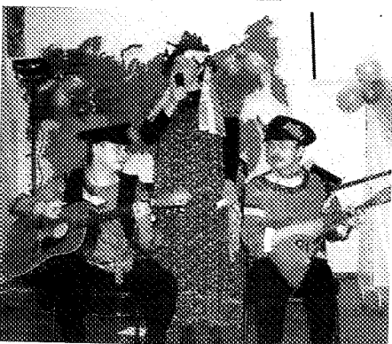
— Мы частушки вам пропели, За живое вас задела...

Но «венцом мужского творчества» стал диск, специально выпущенный к женскому празднику. Здесь сотрудники НИИКа спели для своих прекрасных коллег лучшие песни. О чем? — спросите вы. Ну, конечно же, о любви! Показ этого видеоролика стал поистине сюрпризом для женской половины компании и не только украсил вечер, но и сделал его незабываемым.