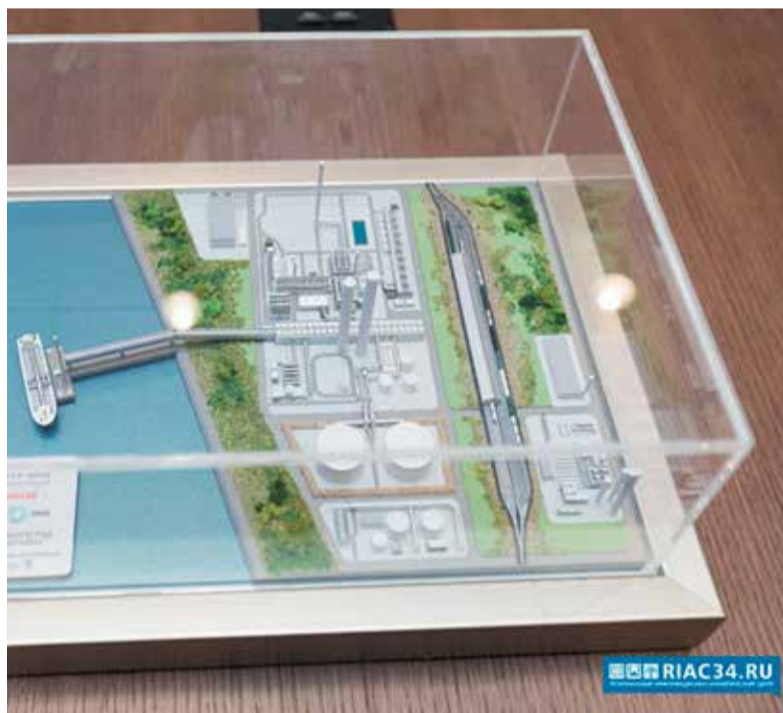
Макет будущего производства

В реализации проекта строительства метанолового завода в Волгограде участвуют российская компания «Джи Ти Эм 1», датская Haldor Topsoe и японская Mitsubishi Heavy Industries Engineering. Завершение строительства завода намечено на конец 2022 года.