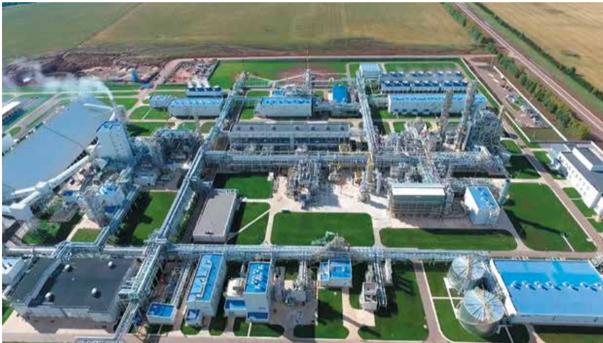
Комплекс «Аммиак-Метанол-Карбамид» в Менделеевске

День строителя, который отмечается в России во второе воскресенье августа, теперь по праву можно считать одним из профессиональных праздников сотрудников НИИК. Наша компания сегодня занимается сдачей объектов под ключ, осуществлением проектных работ, управлением строительством и поставку оборудования.