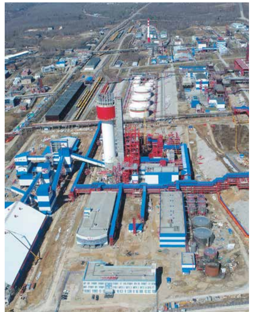
Комплекс «Аммиак-Карбамид-Меламин» в Губахе

– Комплекс работ по проектированию, строительству и поставкам оборудования вывел НИИК на новый уровень. Опыт со строек накапливается от объекта к объекту и обеспечивает нашей компании крупные серьезные контракты, а заказчикам – минимизацию затрат и сокращение сроков окупаемости. На этом пути у НИИК ещё очень много работы, но компания прикладывает максимум усилий для развития и совершенствования строительного направления.