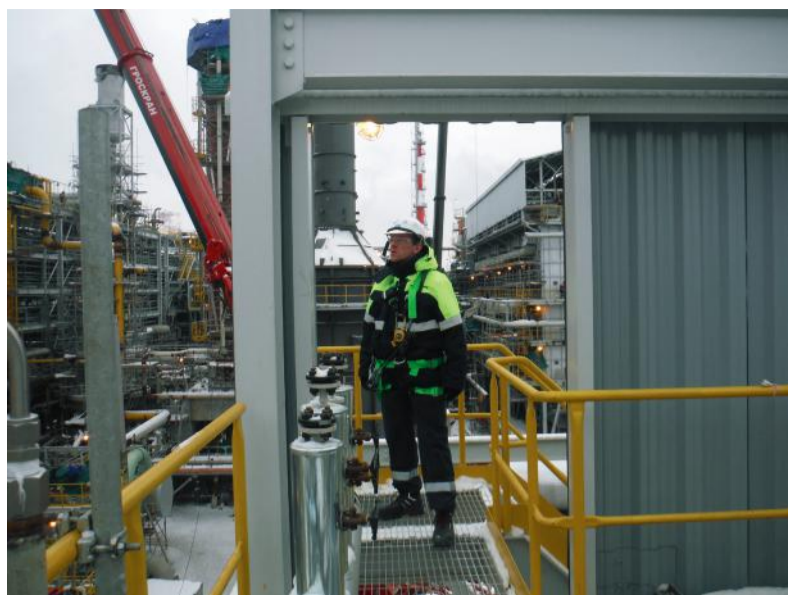
На АО «ФосАгро-Череповец»

Каждому человеку хочется работать в успешной и процветающей компании. А ведь делаем ее такой именно мы, сотрудники. На своем рабочем месте мы стараемся выполнить свою работу чуть лучше, эффективнее и профессиональнее, чем вчера, тем самым выстраивая вектор успеха своей группы, отдела и организации в целом.