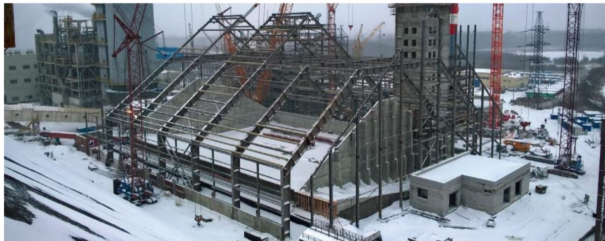
Склад гранулированного карбамида насытью

КФК), а также объекты общезаводского хозяйства и обеспечение подключения энергоносителей.