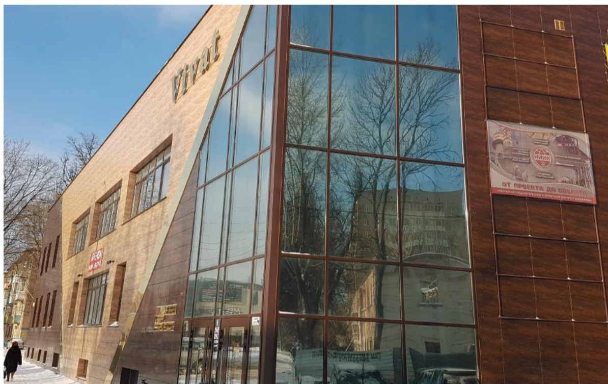
В этом здании располагается офис НИИК в Новомосковске

Принятые на постоянную работу специалисты имеют большой опыт работы в проектировании опасных производственных объектов азотной промышленности, в том числе производств аммиака, метанола, селитры и азотной кислоты, что позволяет диверсифицировать проектный портфель института в новые производства. Для новых работников МО и НКО были организованы психологические тренинги, групповые и индивидуальные курсы