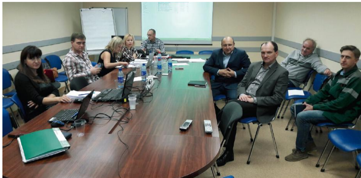
Переговоры по строительству производства карбамида в Перми

комплекса «Аммиак-Метанол-Карбамид» в Менделеевске состоялось в феврале 2016 года, итоги подведены, и сегодня предприятие стабильно работает, гарантийные обязательства ОАО «НИИК» по объекту закончились только 30 ноября 2016 года. Таким образом,