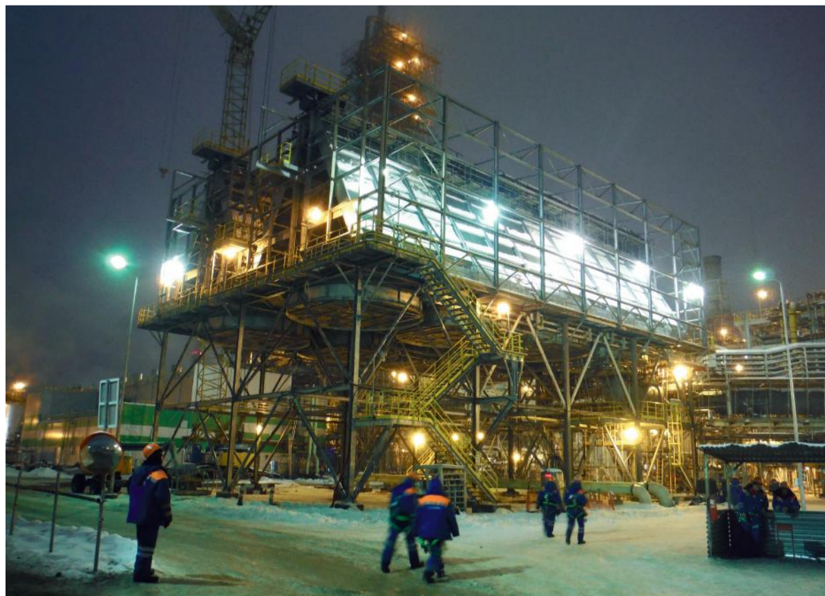
Строительство производства аммиака в Череповце

БУДЕТ ВНЕДРЕНА И СОБСТВЕННАЯ РАЗРАБОТКА НАШЕГО ОТДЕЛА СИСТЕМ ОПТИМАЛЬНОГО УПРАВЛЕНИЯ – ЕДИНАЯ ИНФОРМАЦИОННАЯ ПЛОЩАДКА ПЛАНОВОГО ОТДЕЛА, БУХГАЛТЕРИИ, ОТДЕЛА КОНТРОЛЛИНГА И ГРУППЫ ПЛАНИРОВАНИЯ, ЧТО ПОЗВОЛИТ ОТСЛЕЖИВАТЬ ЭТАПЫ РАБОТ В РЕЖИМЕ РЕАЛЬНОГО ВРЕМЕНИ И ЗНАЧИТЕЛЬНО СОКРАТИТ ВРЕМЯ НА ОТЧЕТЫ.