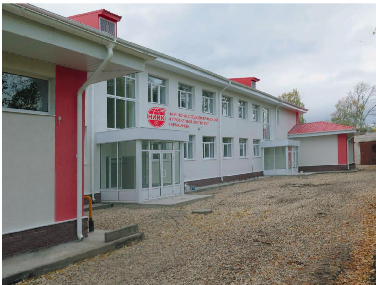
Корпус 4 приобретает корпоративный стиль

Хочется выразить благодарность за содействие техническому руководству компании и проектным отделам, планово-производственному отделу и финансовой службе в целом, юридической службе, службе персонала, отделу документационного обеспечения управления, отделу охраны труда и службе безопасности.