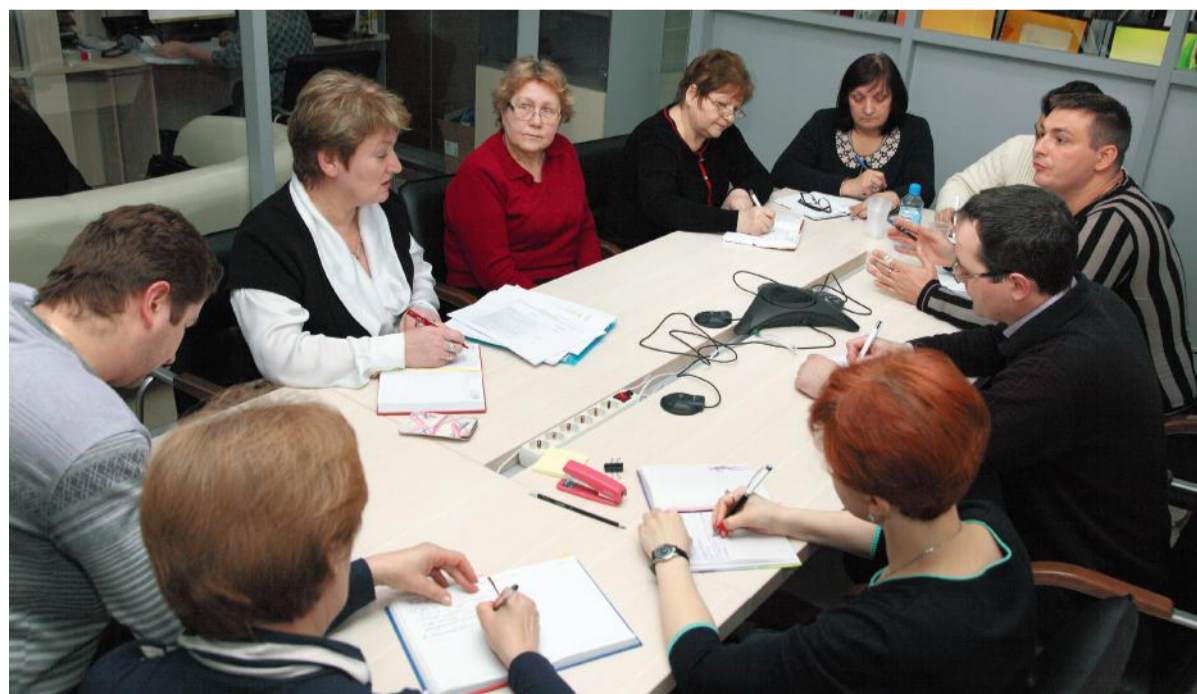
Совещание в Новомосковском комплексном отделе

В 2017 ГОДУ ПЛАНИРУЕТСЯ ДАЛЬНЕЙШЕЕ РАСШИРЕНИЕ КАК ПРОЕКТНОГО ПОРТФЕЛЯ, ТАК И ЧИСЛЕННОСТИ ПЕРСОНАЛА МО И НКО. СОТРУДНИКИ МО И НКО ГОРДЯТСЯ ТЕМ, ЧТО СТАЛИ ЧЛЕНАМИ БОЛЬШОЙ И ДРУЖНОЙ СЕМЬИ ПОД НАЗВАНИЕМ НИИК, С УВЕРЕННОСТЬЮ СМОТРЯТ В БУДУЩЕЕ.