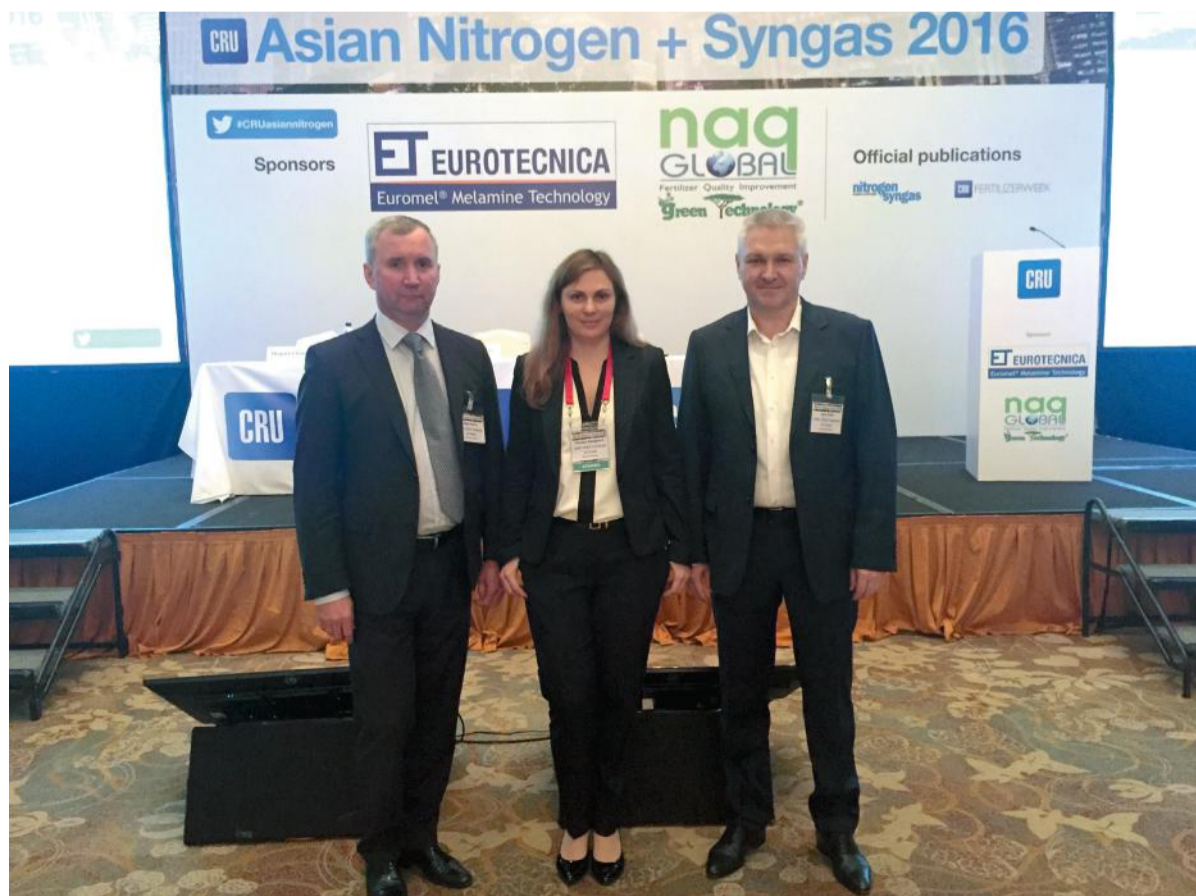
Asian Nitrogen + Syngas 2016

С индийскими партнерами на семинаре обсуждались стратегии развития бизнеса нашей компании в регионе. На встрече с Торговым представительством РФ в Республике Индия обсуждались вопросы сотрудничества по продвижению технологий и услуг ОАО «НИИК». Были проведены переговоры с одним из крупнейших ЕРС-подрядчиков в Индии по вопросам участия в крупных проектах по реконструкции производств карбамида.