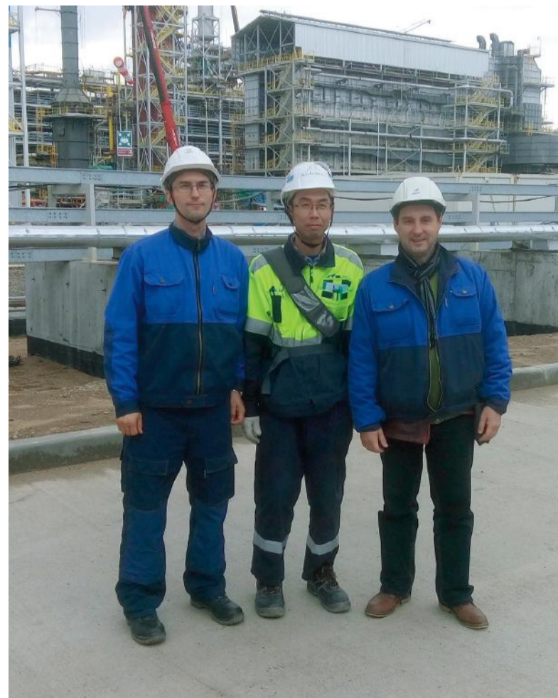
Международное сотрудничество – в действии!

В лаборатории будет работать шесть химиков АО «ФосАгро-Череповец», которые уже прошли обучение у специалистов НИИК.