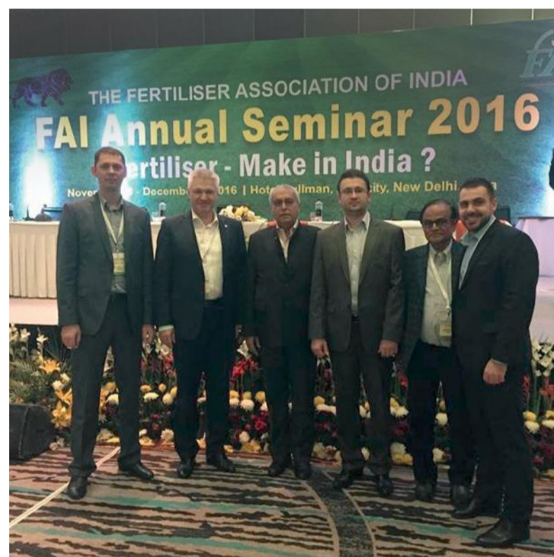
FAI Annual Seminar 2016

В рамках семинара делегация ОАО «НИИК» провела множество встреч с индийскими производителями удобрений. Многие компании интересовались не только технологиями НИИК в области повышения эффективности