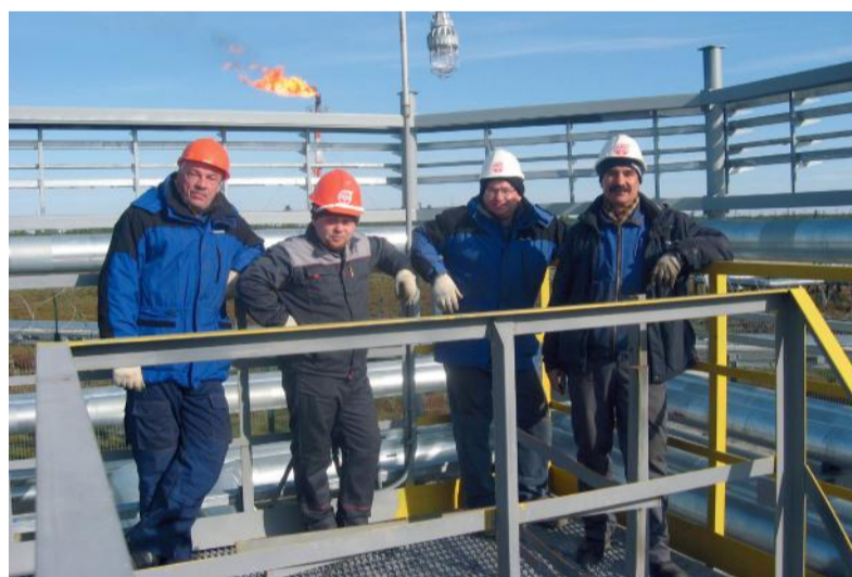
На предприятии ООО «Соровскнефть»

В 2016 году стартовал комплекс работ по ремонту реактора карбамида для компании Egyptian Fertilizers Company (EFC, Египет). Инженеры НИИК разработали необходимую техническую документацию, обеспечена поставка металлопродукции и приспособлений для выполнения ремонта. Сегодня оборудование находится на пути к заказчику – доставляется морским путем. Первый