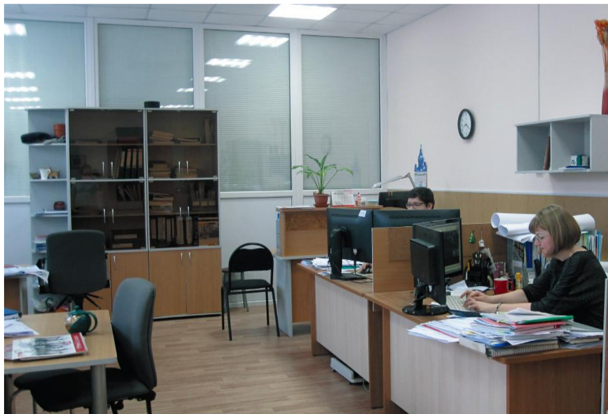
Инженерам комфортно работается в отремонтированных кабинетах

Сочетание опыта, знаний ветеранов и задора молодых сотрудников позволяет решать программы любой сложности.