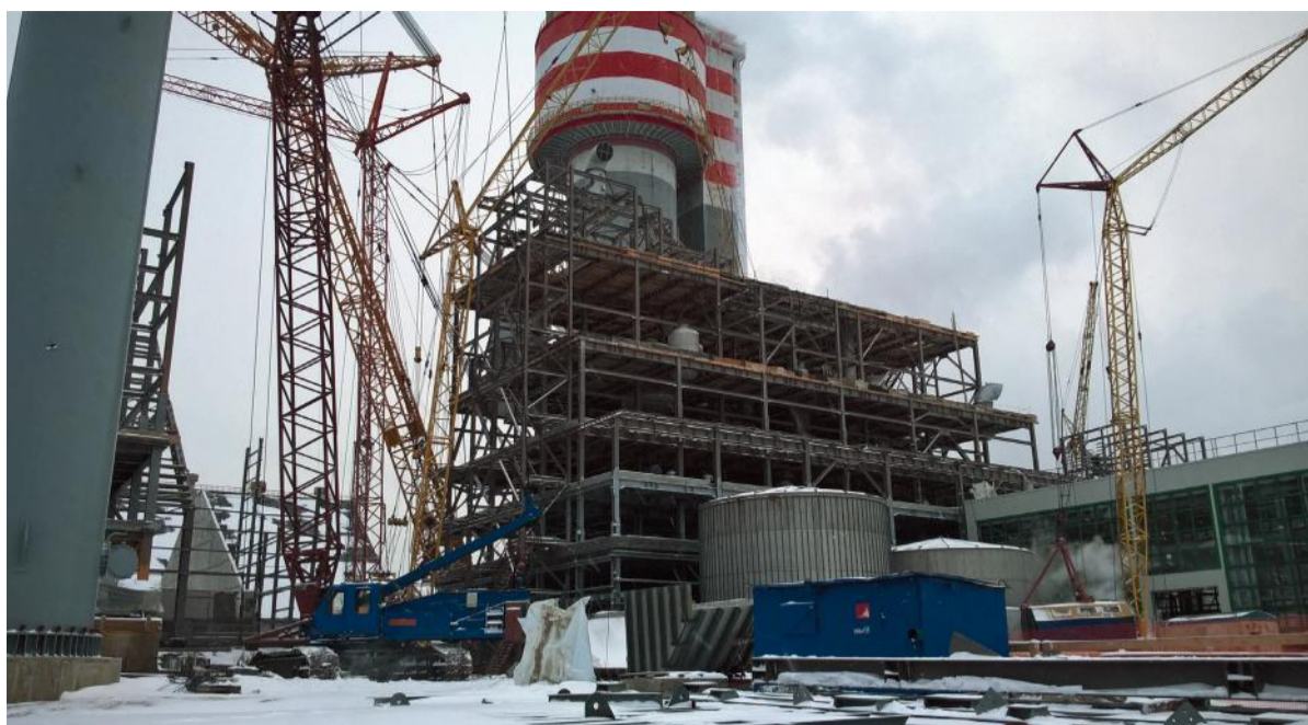
Этажерка производства карбамида

базового проекта Chemoproject Nitrogen AS (Чехия) по технологии процесса производства фирмы Stamicarbon (Нидерланды) к российским нормам и правилам, рабочую документацию складского комплекса (склад гранулированного карбамида на 20 000 тонн, поточно-транспортную систему, узел отгрузки и узел приема и подачи